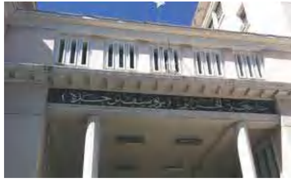
قوانين ردمية للحد من السرقة العلمية

سرقة علمية بمفهوم المادة 3 من القرار وله صلة بالأعمال العلمية والبيداغوجية المطالب بها من طرف الطالب في مذكرات التخرج في الليسانس والماستير والماجستير والدكتوراه قبل أو بعد مناقشتها يعرض صاحبها إلى إبطال المناقشة وسحب اللقب الحائز عليه. وفيما يتعلق بالأساتذة تنص المادة 36 من القرار على أنه دون المساس بالعقوبات المنصوص عليها في الأمر رقم 06 - 03 المؤرخ في 15 جويلية 2006 كل تصرف يشكل