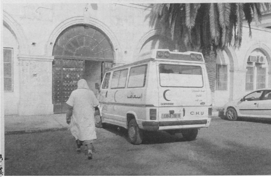
5500 منصب جديد في قطاع الصحة

قررت وزارة الصحة فتح باب التوظيف للممرضين والقابلات كأكبر عملية منذ سنوات بأكثر من 5500 منصب، حيث استنجدت بحاملي بكالوريا 2015 وكذا أصحاب الشعب الأدبية والفلسفة لسد العجز الفادح في هذين السلكين، الذي تجاوز 70 بالمائة، وكان وراء قرار المسؤول الأول عن القطاع تجميد طلبات التقاعد المسبق بالمستشفيات والعيادات موازاة مع تمديد سن تقاعد مستخدمي هذا القطاع، إلى غاية معالجة هذا المشكل جذريا.