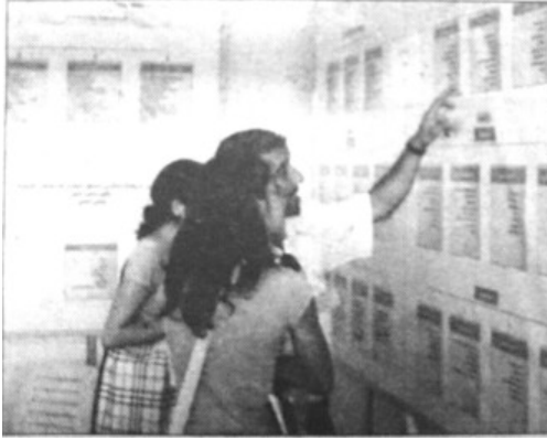
علاقة إلكترونية بين الطالب والجامعة