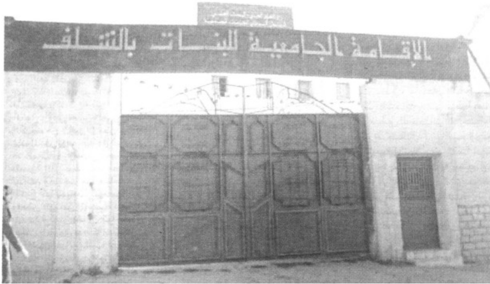
الإقامة الجامعية بالشلف

تشهد بعض مشاريع الترميم والتهيئة عبر الأحياء الجامعية بالشلف تأخرا في إنهاء أشغالها مما قد يؤثر سلبا على مستوى استقبال الطلبة الذين تضاعف عددهم هذه السنة.