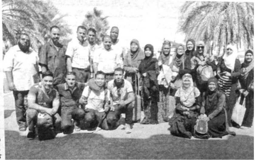
طلبة ماليزيين في الوادي

وأفاد مدير جامعة الوادي، الدكتور عمر فرحاتي، بأن الوفد الطلابي الماليزي يتكون من 11 طالبا (9 طالبات وطالبان اثنان) سيدرسون بداية من الموسم الجامعي الجاري مجموعة من التخصصات في اللغة العربية بكلية الآداب واللغات بالجامعة، وأوضح أن هذا النشاط العلمي الدراسي لطلبة ماليزيا يندرج في إطار تفعيل التبادل الطلابي الذي تضمنته بنود اتفاقية التبادل والتعاون الموقعة بين مديري