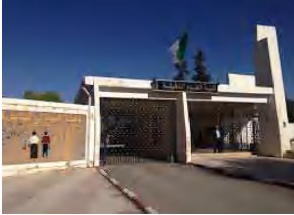
جامعة جيلالي اليابس

● تمشي جامعة جيلالي اليابس، بسيدي بلعباس، حالة من الغليان جراء تفجير أستاذة محاضرة بقسم الرياضيات بكلية العلوم الدقيقة، فضيحة تتعلق بتضخيم نقاط طلبة التدرج، ومنح شهادات الماجستير للطلبة من دون بذل أي جهد، ونهب وسرقة معدات، حسبما كشفت عنه المتحدثة له الخبر، مرفقة بشكاوى أرسلتها إلى كل من وزير التعليم العالي والبحث العلمي، وإلى وكيل الجمهورية لدى محكمة سيدي بلعباس.