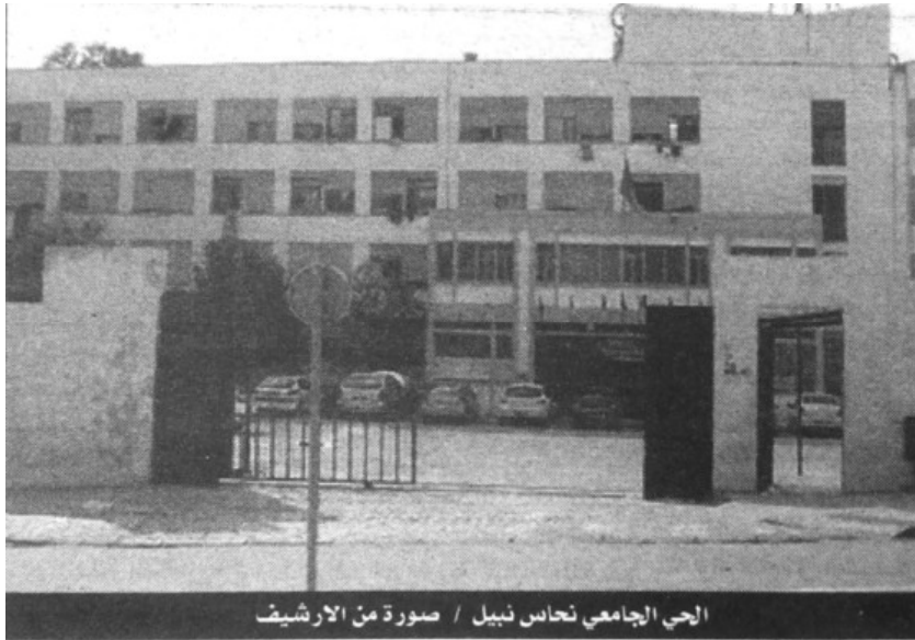
الحي الجامعي نحاس نبيل / صورة من الارشيف

قالت صديقات الضحية للشروق اليومي، بأنها عانت منذ أن كانت تشتغل ضمن تظاهرة قسنطينة عاصمة الثقافة العربية، من مرض معقد على مستوى القلب والغدة الدرقية، ولكنها في الفترة الأخيرة استرجعت عافيتها، قبل أن تفاجئها نوبة حادة في حدود الرابعة من عصر الأحد عندما خرجت من حجرتها الكائنة بالجناح أ، أودت بحياتها، حيث تم نقلها إلى أقرب عيادة صحية في حي فيلالو ولكنها توفيت، وسط صدمة لدى طالبات الإقامة اللائي نضين إشاعة الإنتحار، ولدى أسرتها القاطنة بمدينة ميللة التي سارعت منذ مساء أول أمس إلى قسنطينة لتقصي الحقائق، حيث تم نقل جثة الطالبة إلى مقر سكنها، وشيخ جثمانها زوال أمس في مسقط رأسها في ميللة. ورفض أعوان الأمن بإقامة نحاس نبيل السماح للشروق اليومي من الاقتراب من الإدارة، بحجة تطبيق تعليمات فوقية وأيضا بسبب تواجد مدير الإقامة في مركز