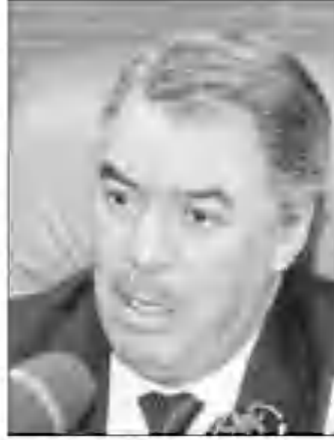
حجار: فتح ملفي النوعية ومشروع المؤسسة هذا الموسم

بخصوص اضراب عمال التراوي بالعاصة فقد إعتبره وزير النقل غير قانوني وغير شرعي من حيث عدم إشعار الوصاية وفقا لما تنص عليه التوانين، ناهيك عن كون الاضراب لم يحترم المستهلك على الاطلاق، ومن ثم فإن الوصاية ستتعامل مع هؤلاء طبقا للمقتانون الساري المفعول، مشبها إلى أنه بالرغم من فتح باب التجاور مع المضربين، إلا أن بعض مطالب هؤلاء تبقى غير منطقية وغير معقولة على الاطلاق على غرار طلب العمل لفترة 4 ساعات فقط في اليوم، إلا أن أهم شيء، بالنسبة للوزارة يكمن في تمكن المواطن البسيط، من استعمال التراوي للثقل في ظروف مريحة وعادية.