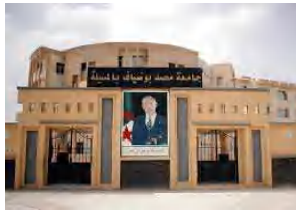
مدخل جامعة محمد بوضياف