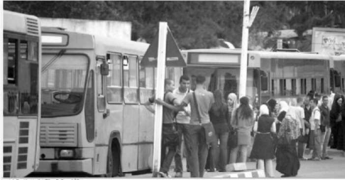
تأخرت قد تكلف الطلبة غاليا