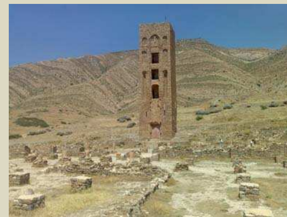
Kalaâ de Beni Hammad