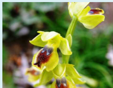
Ophrys battandieri C.

République Algérienne Démocratique et Populaire Ministère de l'enseignement supérieur et de la recherche scientifique