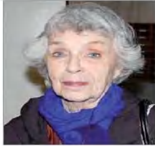
La sociologue algérienne Fanny Colonna.

Née en 1934 à Theniet El Abed, dans la wilaya de Batna, et décédée en novembre 2014, cette sociologue a