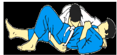
Yoko shiho gatame