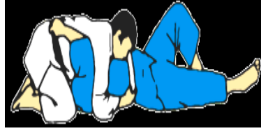
Kami shiho gatame