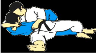
Hon kesa gatame